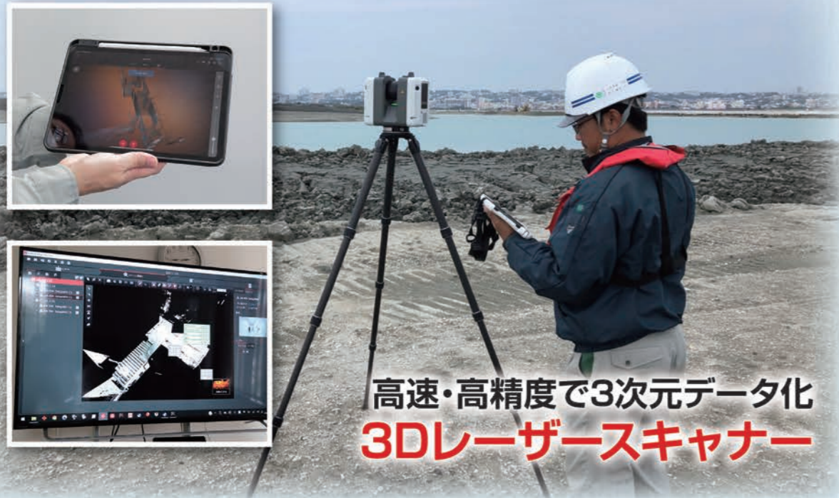
レーザースキャナ計測状況

リースの対象物件といえば、小さなものはOA機器・パソコンから、大きなものは船舶・航空機に至るまで、広い分野にわたって、お客様のニーズにえています。 そこで、このコーナーでは、当社が選定したリース物件にスポットを当てて紹介します。