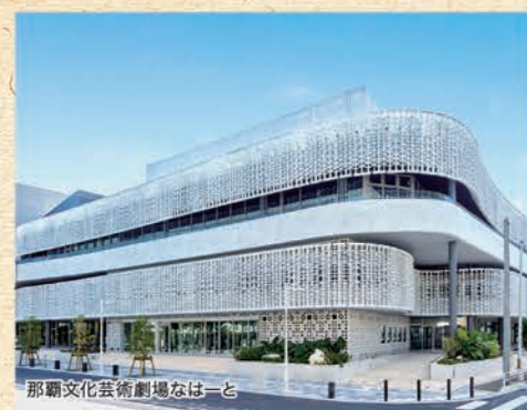
那覇文化芸術劇場なはーと

周辺の文教的環境保護のため、1659年に前島久茂地文教地区が指定されました。1966年には青少年健全育成の場として「沖縄少年会館」が建設され、1979年からは那覇市久茂地公民館図書館として使用されていました。