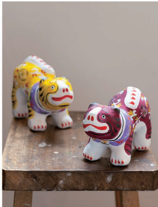
作品名:「干支 寅(大)」 古いデザインのように見えますが創作張り子です。 中国の布製の玩具と沖縄の古い張り子をベースに新しく考えました。 黄色と赤色の2種類があります。

玩具ロードワークス 那覇市牧志3-6-2 ☎ 098-988-1439 https://toy-roadworks.com